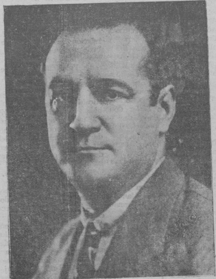
El eminente divo que esta noche debuta en el Teatro Principal cantando «Aida»

simismo envolviéndolo todo con su hosca capa; la críste condición humana que siente aletear en el alma la continua pesadilla sobre el porvenir, plagado de los fantasmas que emergen de las agitaciones espirituales. Vanidad y ambición no saciada. Goethe quiere presentar al lector la contemplación objetiva de un mundo moral. El Doctor habla como filósofo pero, en realidad el filósofo no existe. El pacto con el diablo repugna a su concepción. En realidad los clamores del Doctor son la consecuencia lógica del fermento de un sufrimiento moral, de las hondas inquietudes y sombras que atormentan, que flagelan su espíritu. En vano pugnarán por llegar al