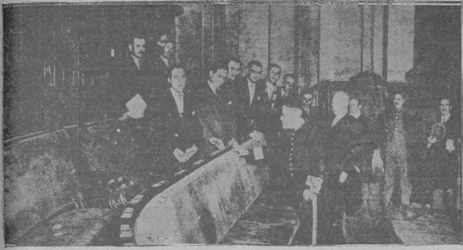
Un portero de la Cámara, señalando el sitio del banzo azul donde dio la piedra arrojada desde la tribuna