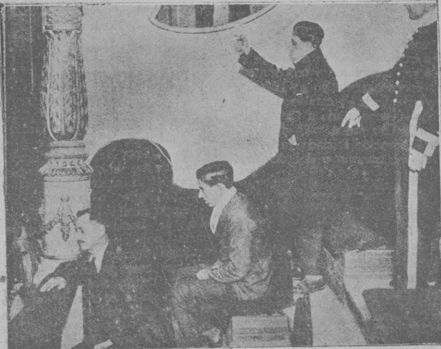
Reconstitución del suceso. Desde este lugar de la tribuna pública arrojó el autor de la agresión la piedra que fué a dar contra el banco del Gobierno, y rompió al rebotar, el cristal de una mampara.