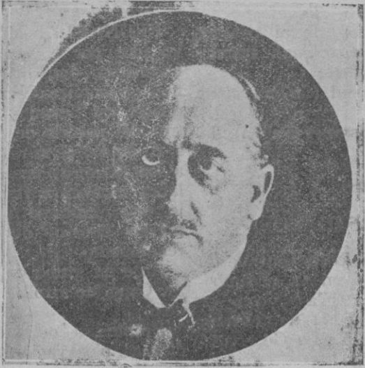
El general Núñez de Prado