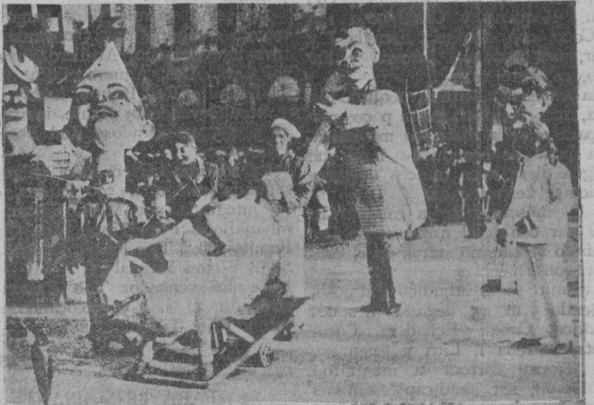
Dos aspectos de la prestigiosa cabalgata

por Osés, que los japoneses en el bombardeo de Chapel.