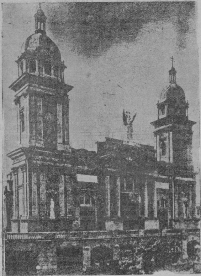
La Catedral de Santiago de Cuba, que ha sufrido desperfectos con motivo de los terremotos