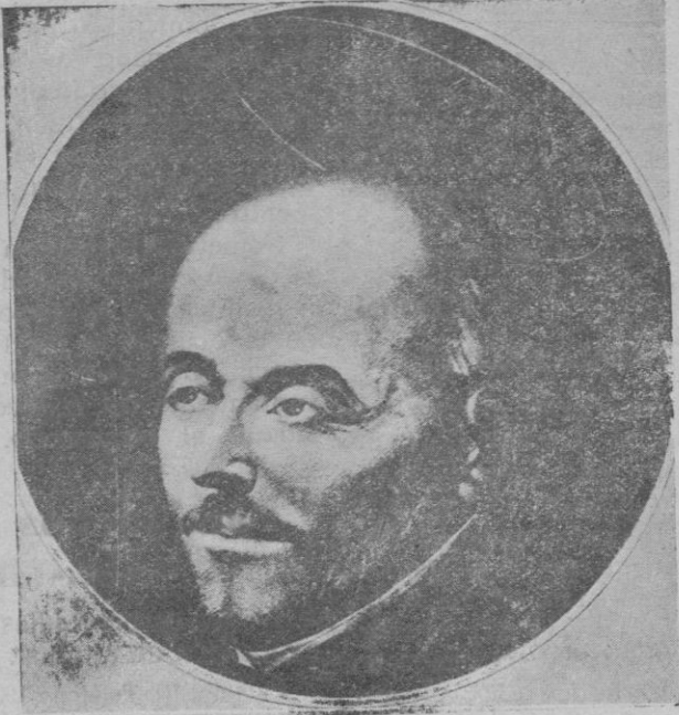
Reproducción de un grabado que representa a San Ignacio de Loyola, fundador de la Compañía de Jesús, que ayer quedó disuelta