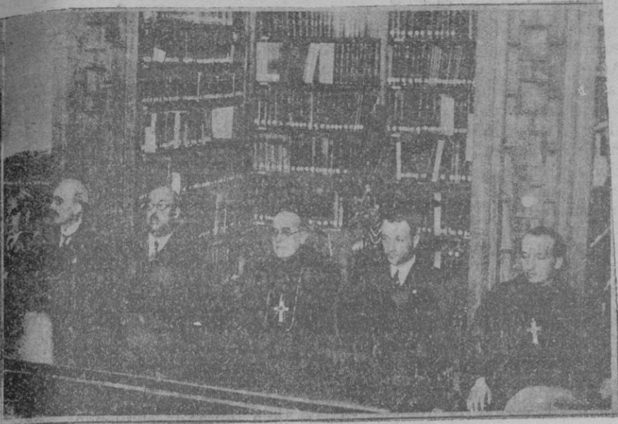
Solemne acto de clausura del VII Congreso de la Prensa Catalano-Balear, celebrado en la sala de la biblioteca del Santuario de Monserrat bajo la presidencia del padre Abad.

acto que debe celebrarse en Valencia por aquellos días.