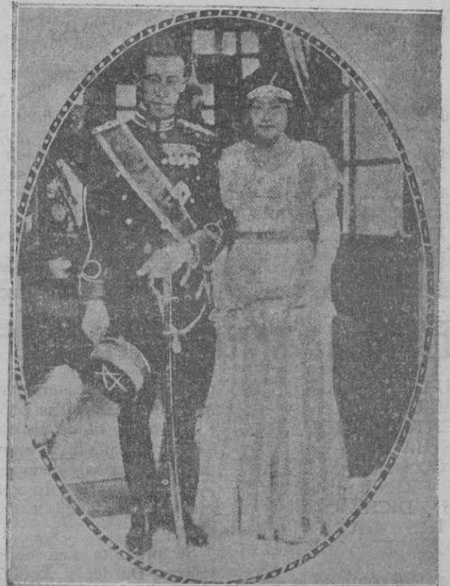
El Príncipe coreano Ri-Ken y la Princesa Chichibú, del Japón, que han contraído matrimonio recientemente en Tokio.