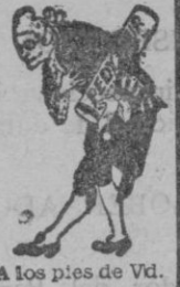
A los pies de Vd.