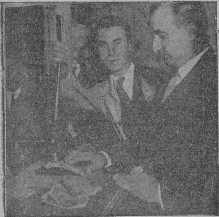
Los empleados del Banco de España con el troquel, que sirve para la estampilla

Aceptadas tales peticiones por la clase patronal representaría por un lado aumentar el coste de producción en cantidades fabulosas, y por otro sería un foco de injusticias, dado que un patrono podría tener la suerte de contar con personal joven, célibe y de escasa familia, y este podría luchar con gran ventaja sobre aquel que tuviese personal que frisase en los cincuenta años o que fuese prolijo.