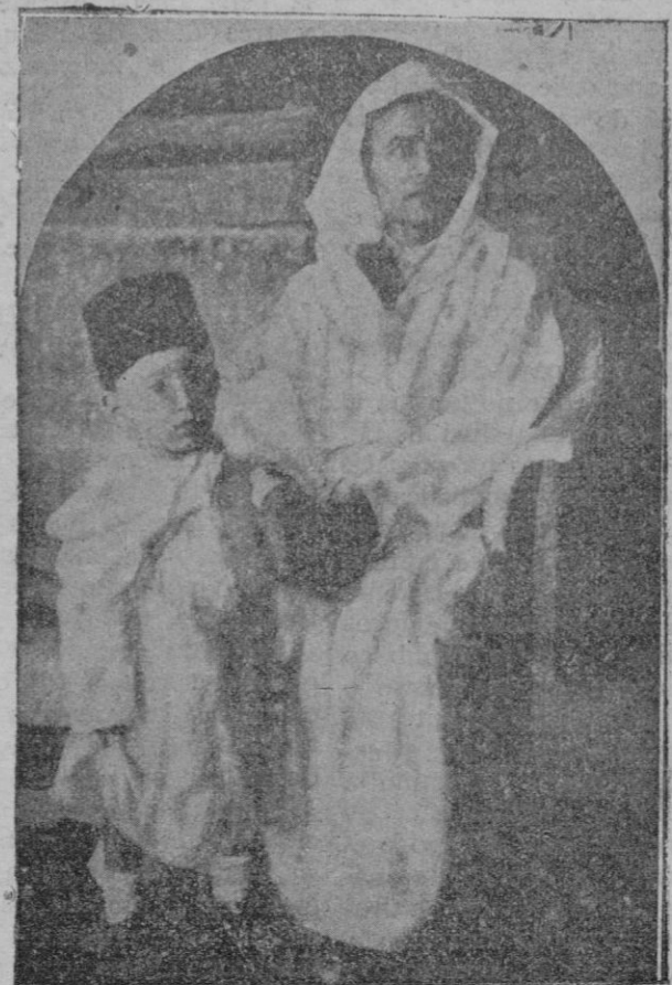
El sultán de Marruecos con su hijo que se hallan de viaje por Francia