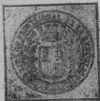
Estampilla con que el Banco de España marca los billetes

Además, de ser, como pretenden los sindicalistas, una acción particular