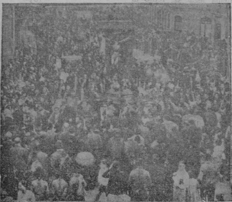
Con gran esplendor se ha celebrado en Vigo la tradicional procesión del Cristo de la Victoria. Un detalle del acto, al paso de la venerada imagen por la calle

necesitan más votos y queda la minoría de derechas, que por azares de la política ha devenido la dueña de la situación. Así que se ha pensado en tres sumando en vez de dos: 11 más 8 más 5 suman 24.