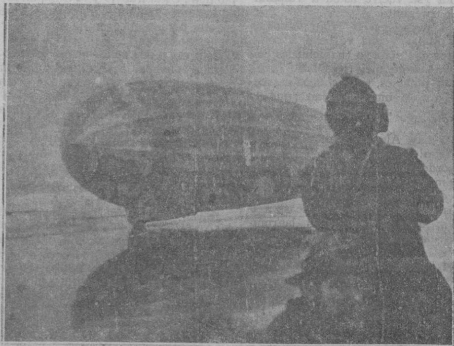
El Zeppelin al aterrizar en el Polo.—En primer término dos tripulantes del «Malygin» al dirigirse en un bote a su encuentro

vulgar y corriente chileno, «para mejor confusión», como diría Calvez y después de los fuertes apretones de rúbrica empezamos por decirle: