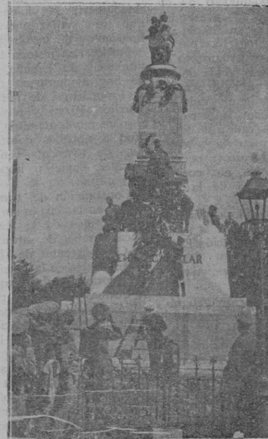
Momento de colocar una corona al pie del monumento a Castelar, después del homenaje que la República ha rendido al ilustre patricio