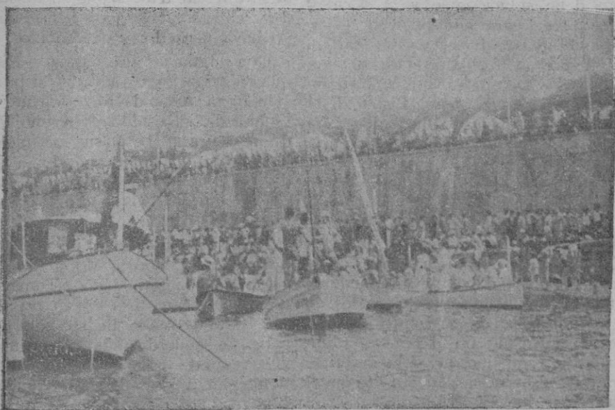
Dos aspectos de la interesante fiesta