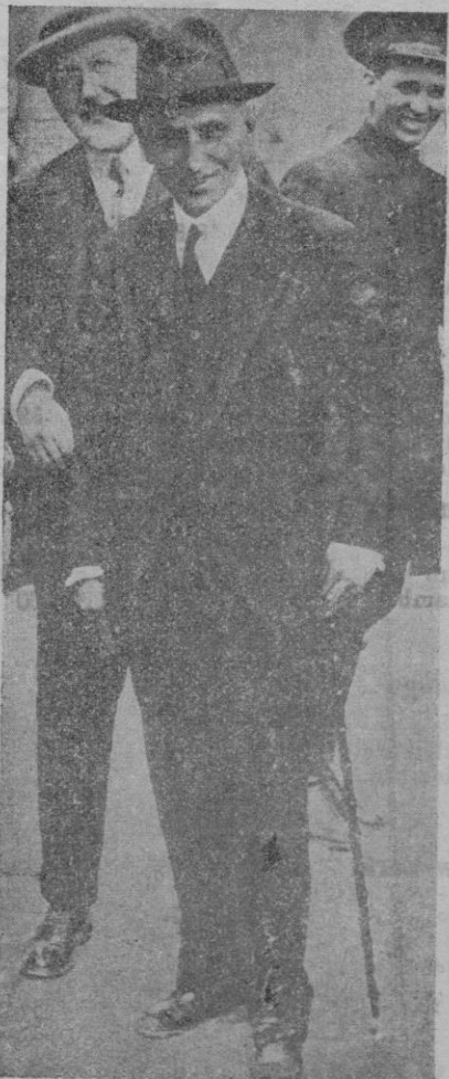
El ilustre político al regresar de dar un paseo en automóvil, convaliente del accidente que sufrió el domingo último

tes. La sociedad no se forma únicamente de seres viciosos, como los seleccionados por Dhey. Por lo tanto el ambiente pintado resulta falso, la situación se desmorona por sí sola, y hasta pierde la emotividad que la hubiera dado el contraste.