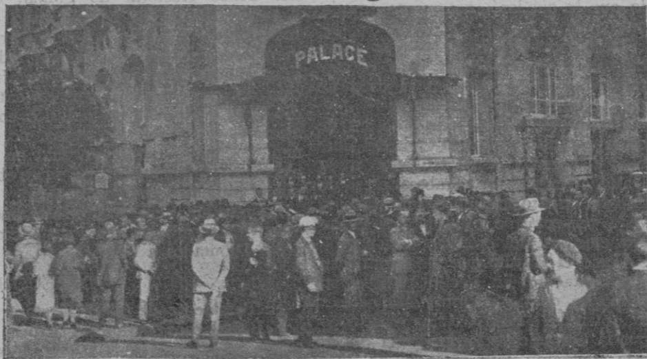
La numerosa concurrencia estacionada frente al Palace Hotel ansiosa de conocer noticias del estado de D. Melquiades Alvarez

tro, forzando otra puerta, penetró en el cuarto dormitorio revolviendo las ropas, apoderándose de un billete de 100 pesetas del Banco de Sóller que la dueña guardaba dentro de una cartera, y otros cuatro también de cien pesetas cada uno que guardaba detrás de un cuadro colgado en la pared.