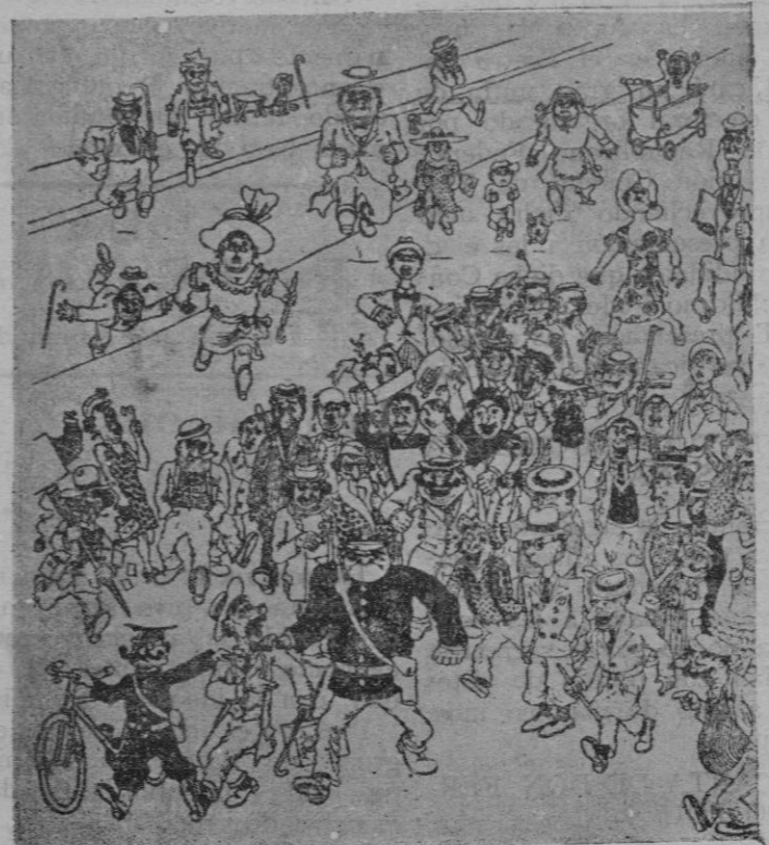
—¡Claro que sí! Yo he dicho: «Mueran el tirano!»; pero, amigos agentes, yo aludía a mi mujer!