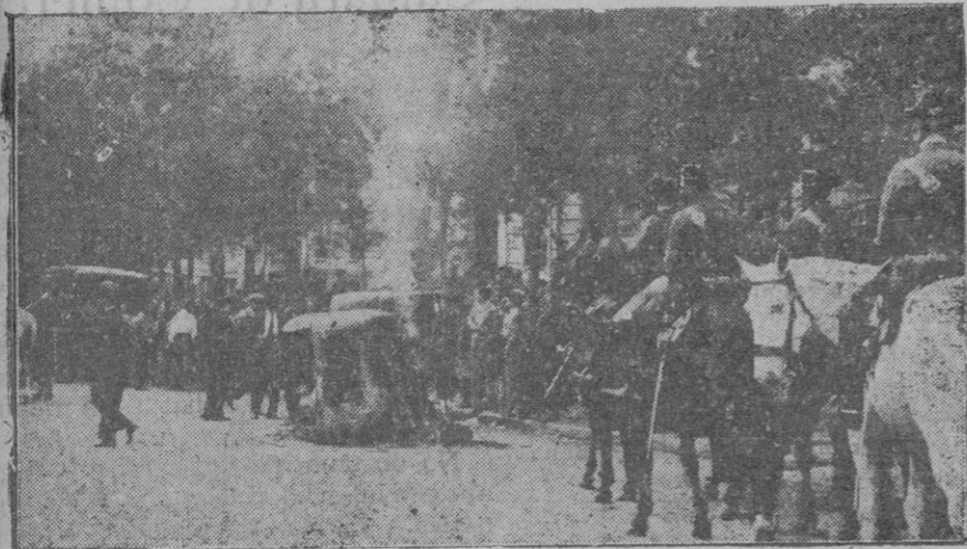
Uno de los automóviles incendiados en la calle de Alcajá