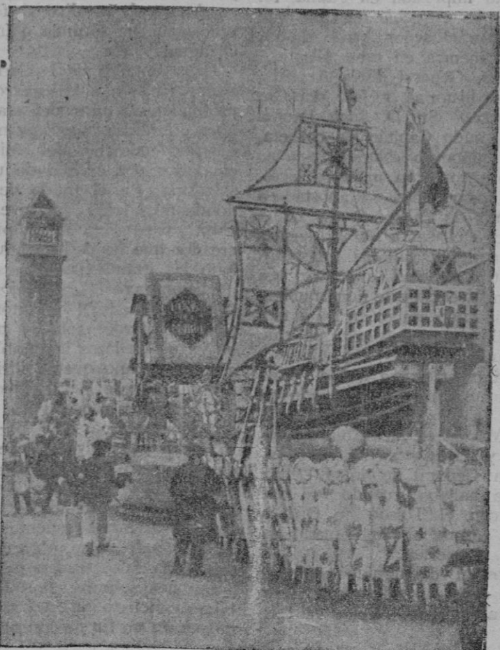
Dos de las más artísticas carrozas que desfilaron por la rúa

conia—en una taberna con aldeanos o en el mercado de la Plaza Mayor de cualquier pueblo conversando con un mendigo.