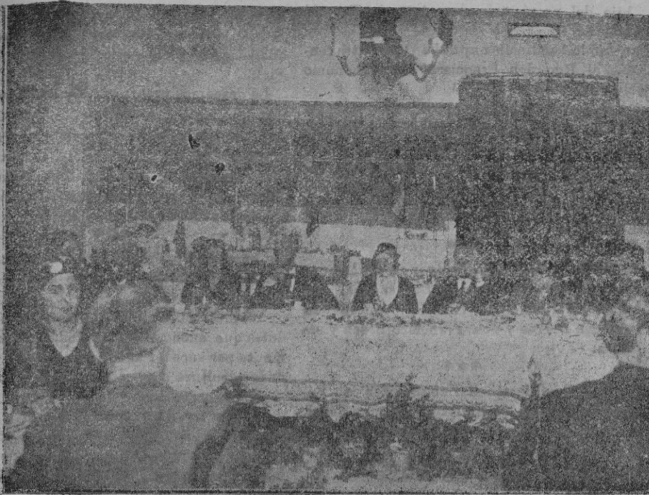
Presidencia del banquete celebrado en el Restaurant «Born», en homenaje a la notable pintora