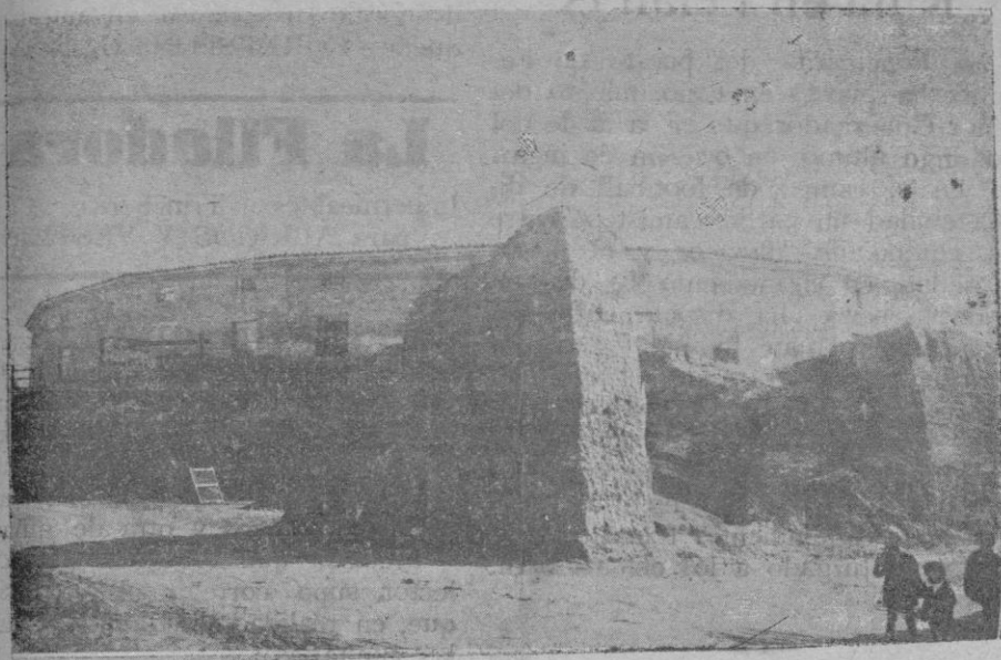
Fachada exterior de la antigua Plaza de Toros.

Puestos a hacer «un poco de historia» creemos que no disgustará a nuestros lectores, poseer algunos detalles de la plaza de toros que existía antes de la que actualmente se está derribando, y que estaba emplazada en su mismo sitio, siendo conocida por nuestros antepasados con el nombre de «els tencats».