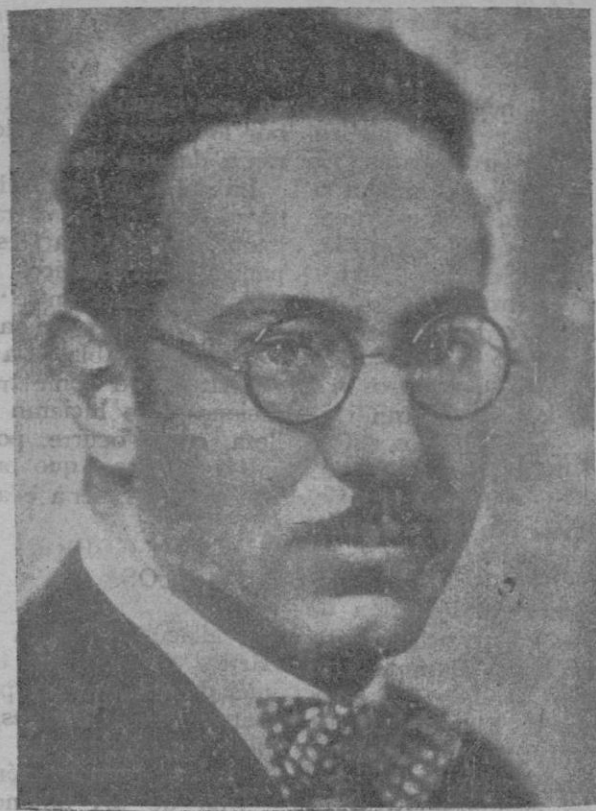
El doctor Lorente de Nó, discípulo predilecto de Ramón y Cajal, que ha sido propuesto por el Comité Europeo, para dirigir el Hospital de Rockefeller, en los Estados Unidos.

tregado a la árdua tarea que le imponen sus múltiples colaboraciones en periódicos de Francia y América y las revistas que publica.