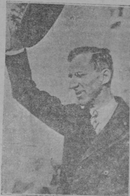
Smedley Butler, jefe de la marina norteamericana que ha pronunciado una conferencia terriblemente injuriosa para el «Duce»

bajos de construcción de la alcantarilla de la calle de Arabí, otro accediendo a varias peticiones de empalme de tuberías de agua potable, y a otras de alcantarilla.