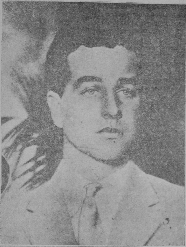
El multimillonario norteamericano Cornelius Vanderbilt, que hizo últimamente unas declaraciones poco favorables para Mussolini, ha recibido tal cantidad de amenazas de muerte, que ha decidido rodearse de una numerosa guardia personal