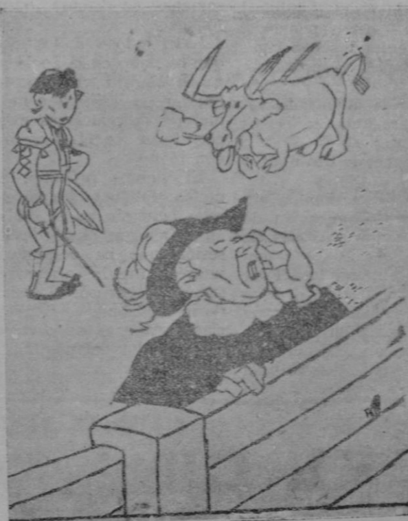
SIGUEN LAS FIRMAS, por K-HITO