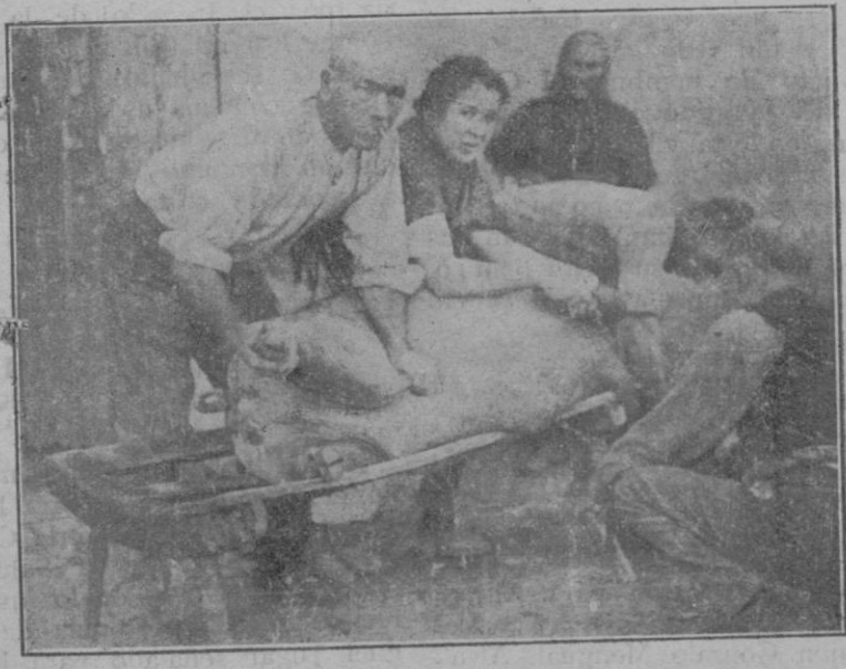
Donant sa sang