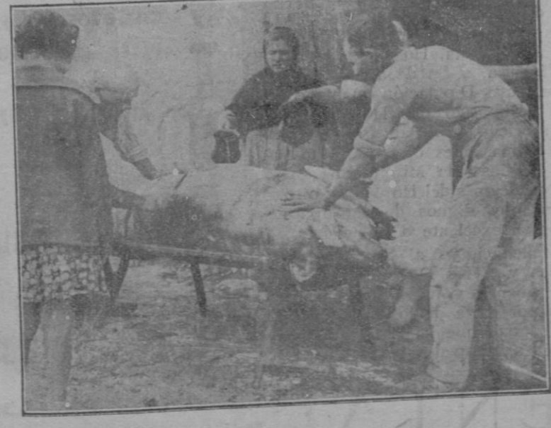
Fent net es porc

Segueix después s'operació de pelar i fer net es porc, operació qu'ès