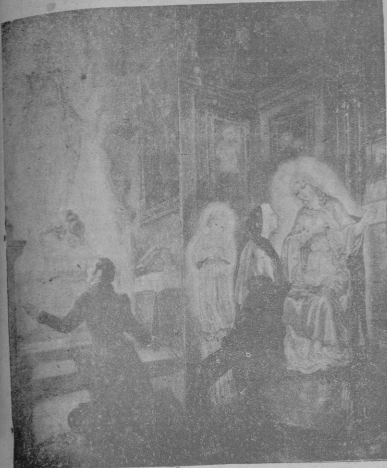
Primera aparición de la Virgen al Judío Ratisbona