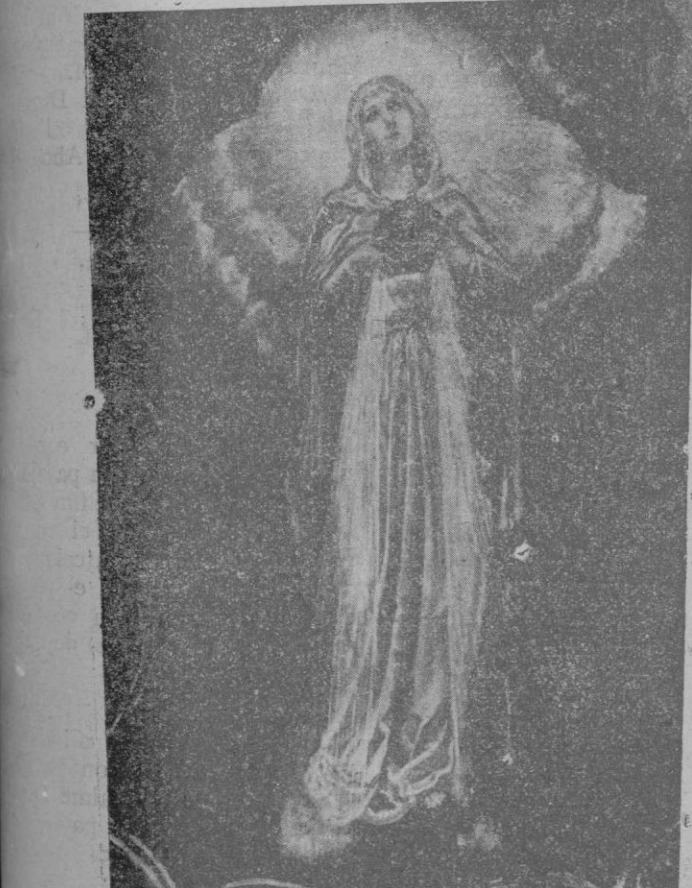
La Virgen intercediendo por nosotros. (Primera fase de la segunda aparición de la Inmaculada a Sor Catalina)

Los pintados para la Iglesia de la Misión por el notable pintor don Pedro Barceló y que esta mañana bendecirá D. m. el Ilmo. Sr. Obispo