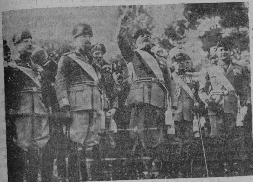
Mussolini pronunciando su bélico discurso durante la ceremonia fascista conmemorativa del octavo aniversario de la Marcha sobre Roma, discurso que ha dado lugar a tantos comentarios y que pone de relieve la importancia mundial que ha adquirido Italia bajo la dirección del Duce