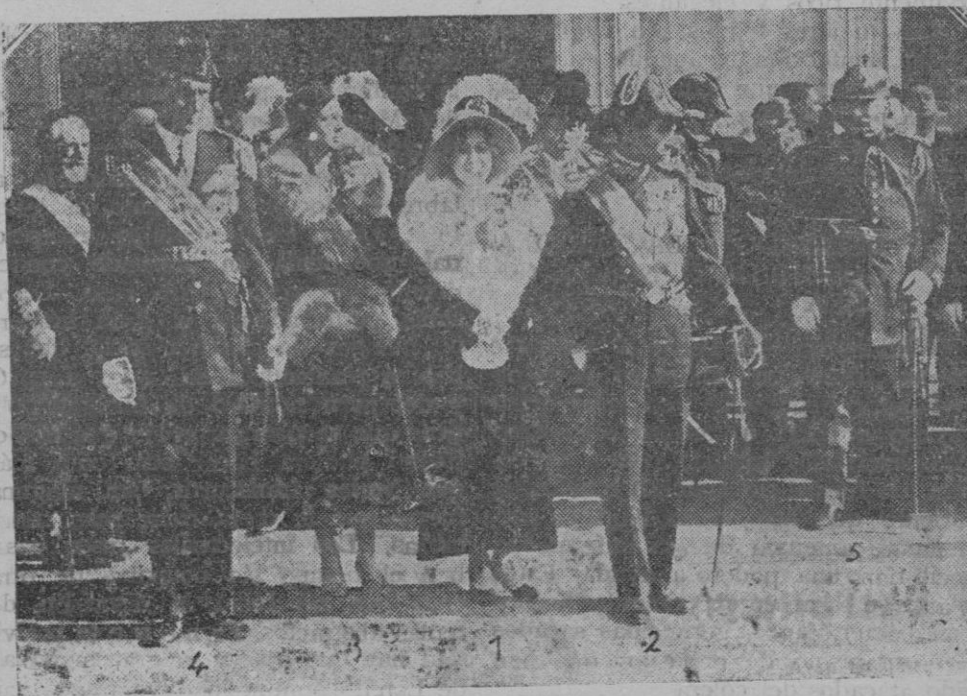
Los Príncipes Takamatsu al salir de la estación del Norte, donde fueron recibidos por Su Alteza la Infanta Beatriz, el Infante Don Alfonso de Orleans y el presidente del Consejo, general Berenguer

gigantes derrotados por el tiempo que sólo enseñan al presente la ornamentación de lo que fueron.