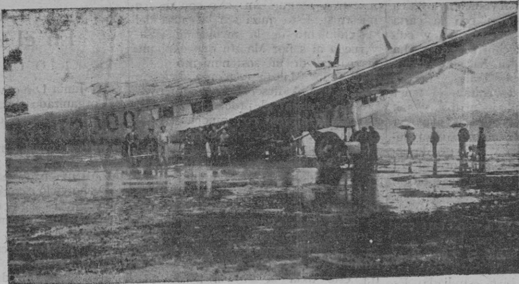
El avión gigante Junkers, al aterrizar en el Plá del Llobregat.—Las personas que aparecen en la fotografía dan idea del tamaño del coloso del aire