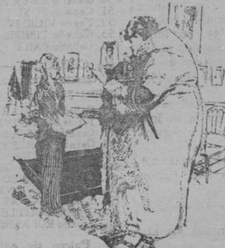
—Lo que yo quiero que me haga es una ampliación. (De «Humorist», de Londres)