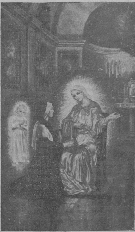
Aparición de la Santísima Virgen a Sor Catalina Labourée.—Cuadro pintado por Pedro J. Barceló con destino a la Parroquia de Pisco (Perú)