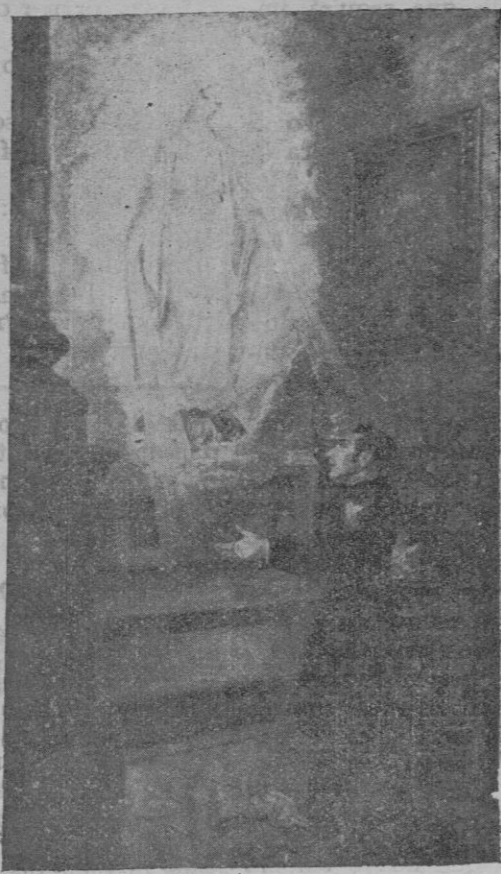
Aparición de la Santísima Virgen al Juicio Ratisbona.—Cuadro pintado por Pedro J. Barceló, con destino a la Parroquia de Pisco (Perú)