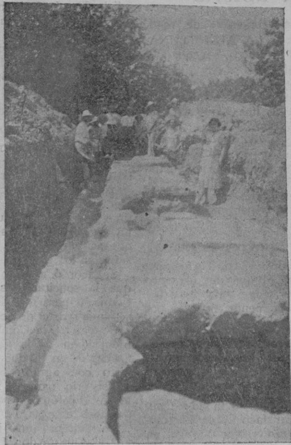
Templo romano. Ruinas descubiertas estos días