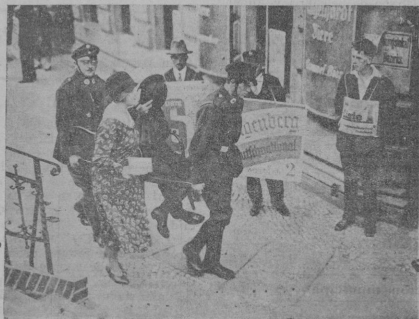
Una escena electoral.—Un enfermo es conducido al colegio para emitir su voto