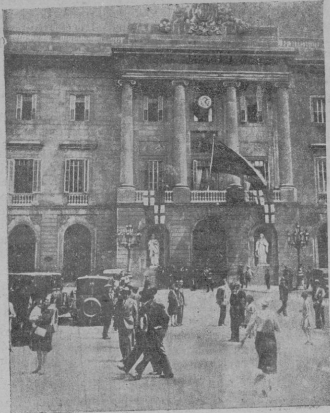
La bandera catalana ondeando por vez primera después de siete años, en los balcones del Ayuntamiento de Barcelona.