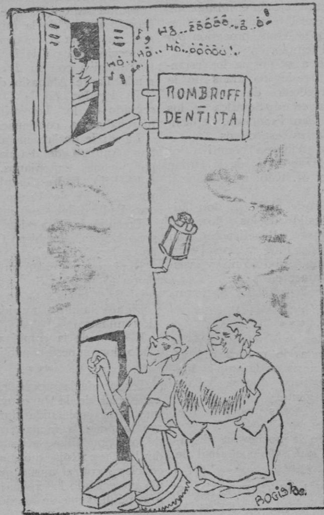
—Canta para hacer creer a los vecinos que su marido tiene clientes.