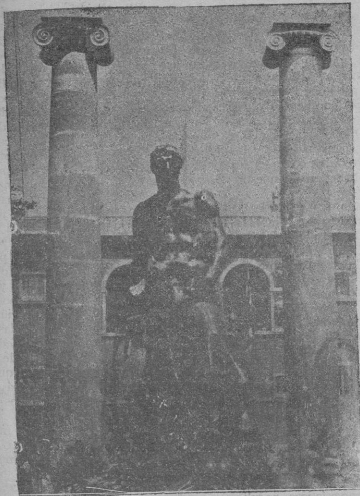
Escultura obra del escultor Llimona, que ha sido descubierta en el recinto de la Exposición de Barcelona como tributo a los obreros que colaboraron en la obra del magno certamen.

las cuales, en el orden cronológico, era la vuestra de Barcelona. Obedecemos a Su Santidad Pío XI, como a Pío X habíamos obedecido al enviarnos a nuestra primera Sede; aquí hicimos nuestro ingreso en 12 de octubre siguiente, festividad de la Virgen del Pilar, siendo por vosotros acogido en forma que nunca podrá borrarse de nuestro agradecido ánimo; y aun cuando, por hallarnos en el caso del Canon 351, § 2, hubimos de asumir el gobierno con plenitud de facultades y, por tanto, con plenitud de labor y, a la vez compartirlo con la Administración Apostólica de Lérida—que desempeñamos desde 18 de septiembre de dicho año hasta 31 de marzo de 1927—, no sólo nunca decayó nuestro espíritu ante la magnitud, únicamente por vosotros ponderable, de la empresa a Nós confiada, sino que con el natural aumento de tareas, seguimos trabajando con la misma tenacidad de esfuerzo, el propio anhelo de provecho espiritual e idéntico desasimiento de interés mundano demostrados en el gobierno del siempre ilustre Obispado ilderdense.