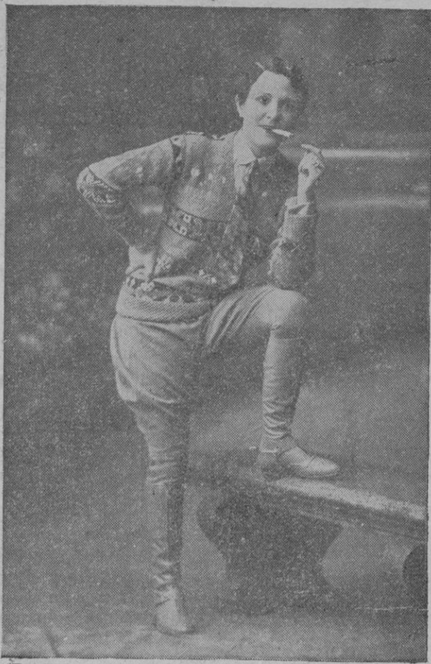
La primera actriz del Teatro Principal con el traje de «El último Lord», obra con la que celebra esta noche su beneficio