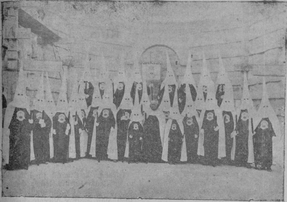
La nueva Cofradía de Nuestra Señora del Carmen, de Santa Catalina