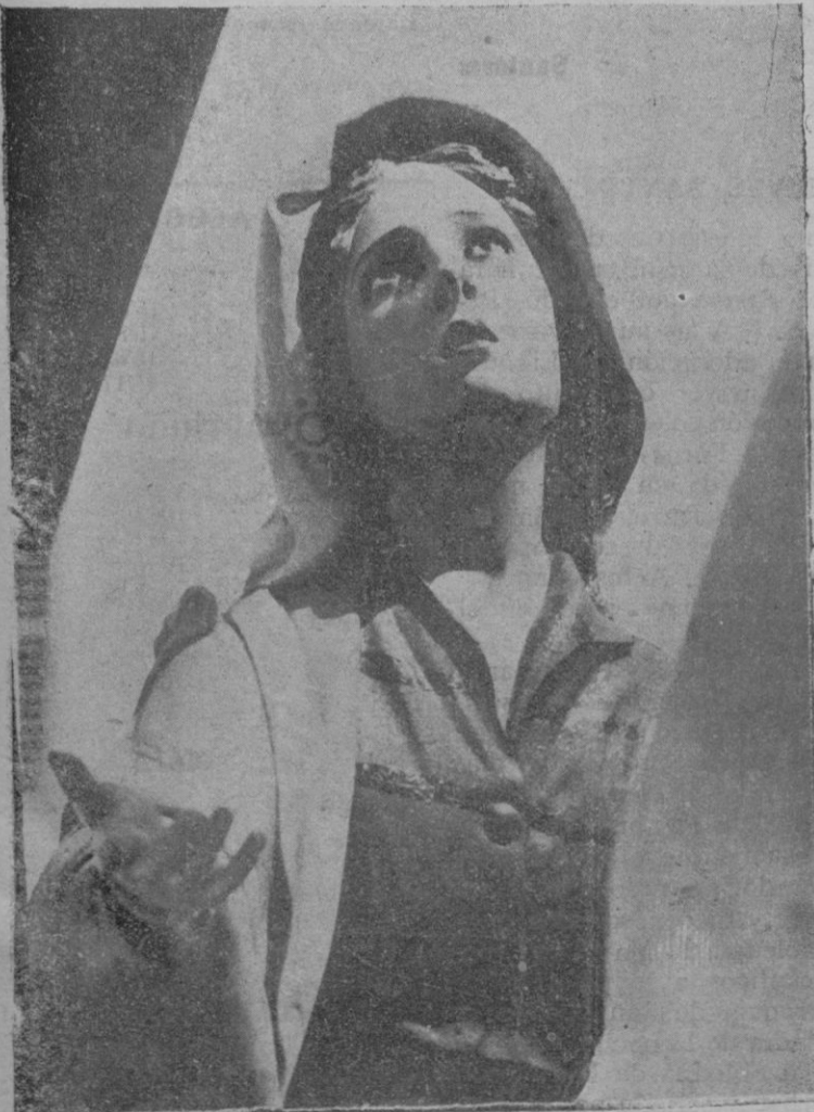
La imagen de la Verónica, del paso de la Santa Faz