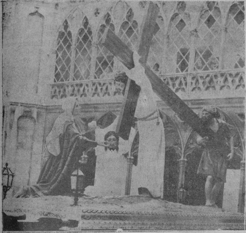
El nuevo «paso» original del notable arquitecto D. Miguel Arcas, que se estrenará en la procesión de esta tarde