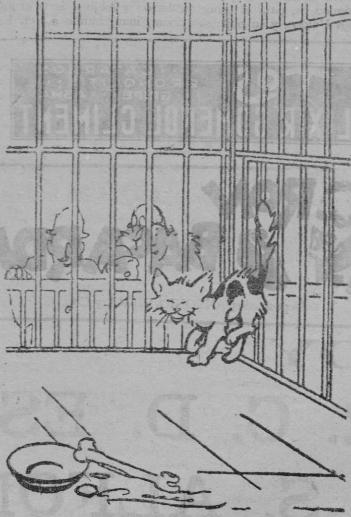
En la Exposición felina. El gato (muy orgulloso).—¡Enjauladol! ¡Me toman por un tigre!