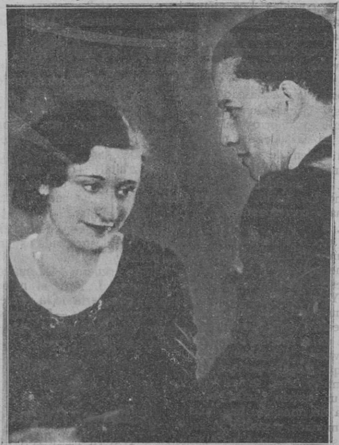
La hija de Mussolini con su prometido