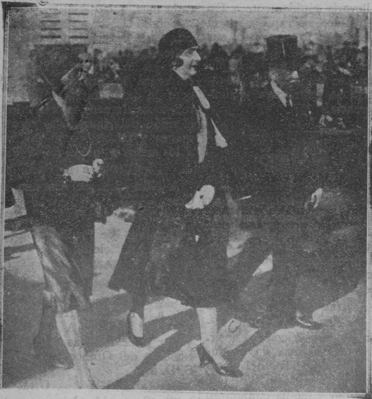
S. M. la Reina paseando con la duquesa de la Victoria por el Hipódromo de la Castellana