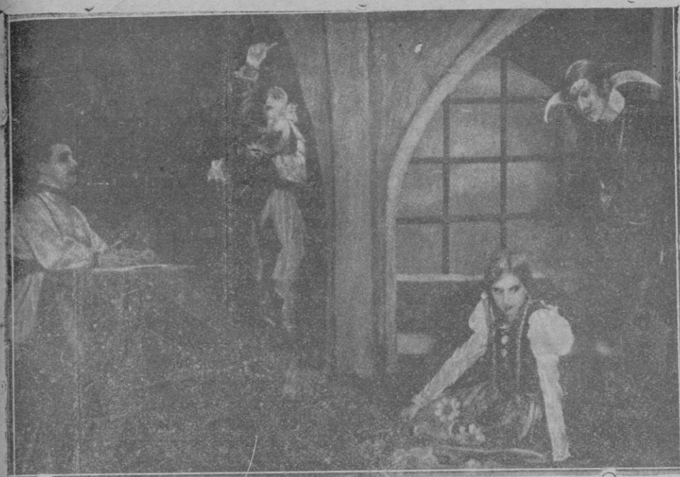
Una escena de la obra de Mario Verdaguer, «El sonido 13», estrenada en el teatro íntimo de vanguardia, «Fantasio», de Madrid