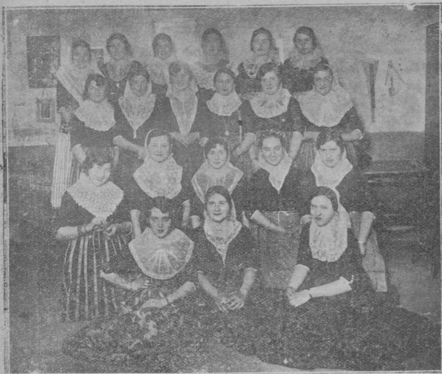
Grupo de señoritas alumnas de piano de la Sra. Cerón, vistiendo el típico traje de payesa mallorquina