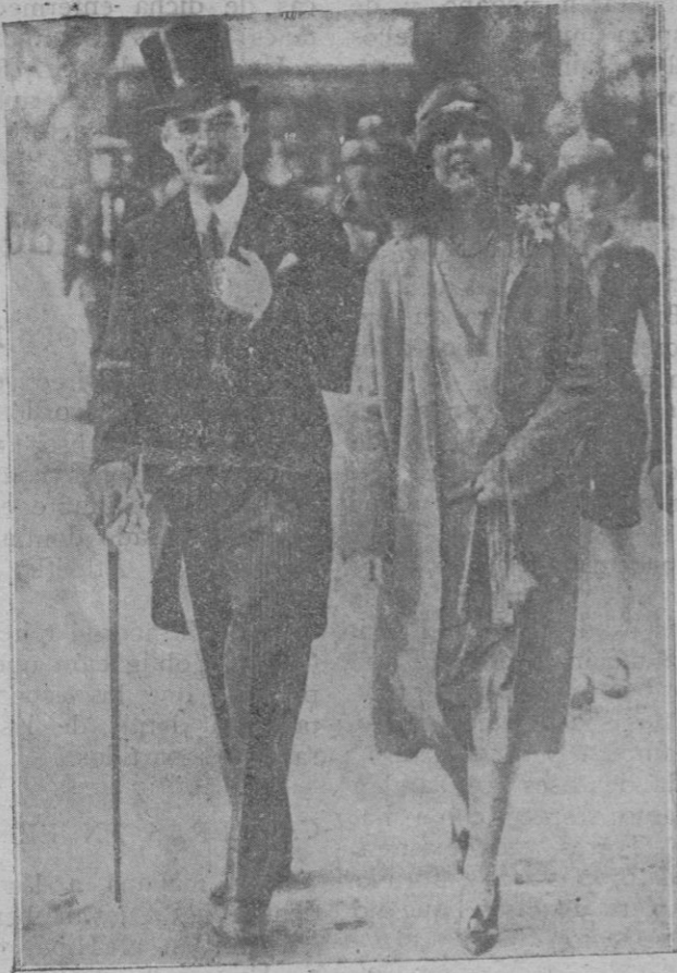
La princesa Charlotte de Mónaco y su esposo, conde de Polinac, a punto de separarse por la anulación del matrimonio que ha pedido la princesa.