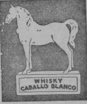
El Whisky «Caballo Blanco»

Es la marca más antigua de España y se distingue por su madurez, suavidad y exquisito paladar; hasta la última gota está madurado en cascos de madera.