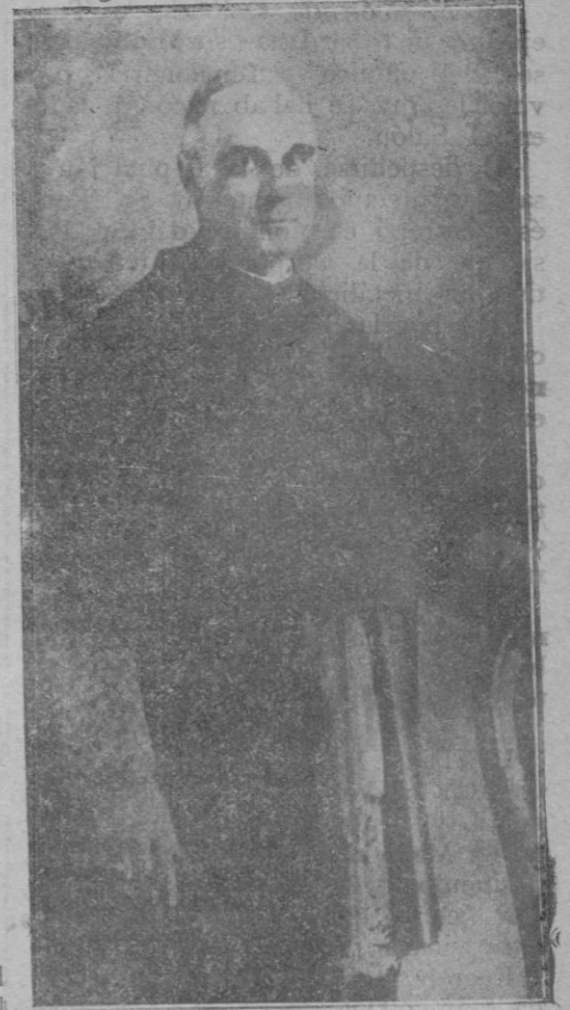
El Cardenal Merry del Val, Secretario de Estado que fué de Su Santidad Pio X, que acaba de fallecer.