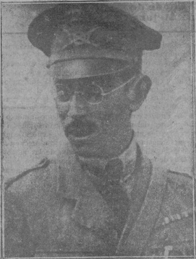
El general de Brigada don Emilio Mola