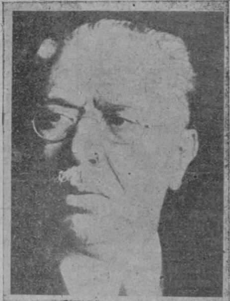
Sr. Ortiz Rubio, candidato de los nacionalistas revolucionarios