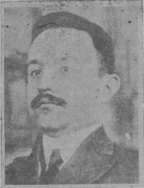
Don José Vasconcelos, candidato del partido antirreeleccionista