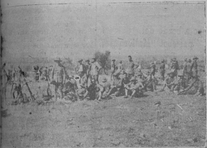
Descanso de la tropa