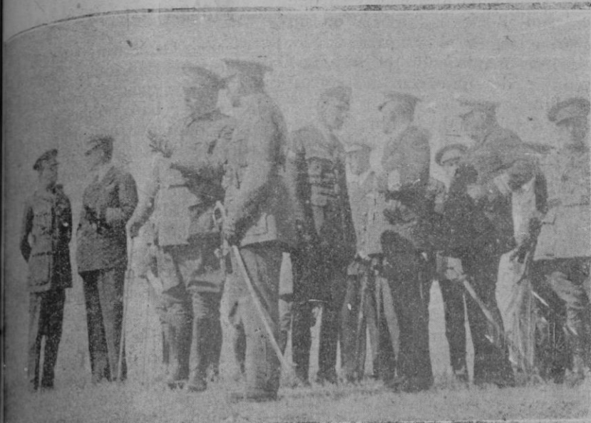
Rey y altas autoridades militares presenciando las maniobras de la Artillería