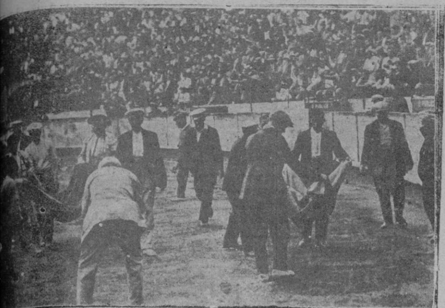
Acto efectuado en la Plaza de Barcelona a favor de la viuda e hijo de Carratalá