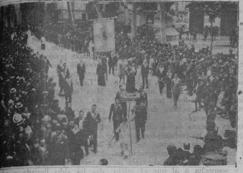
El paso de la procesión por la plaza de Santa Eulalia.