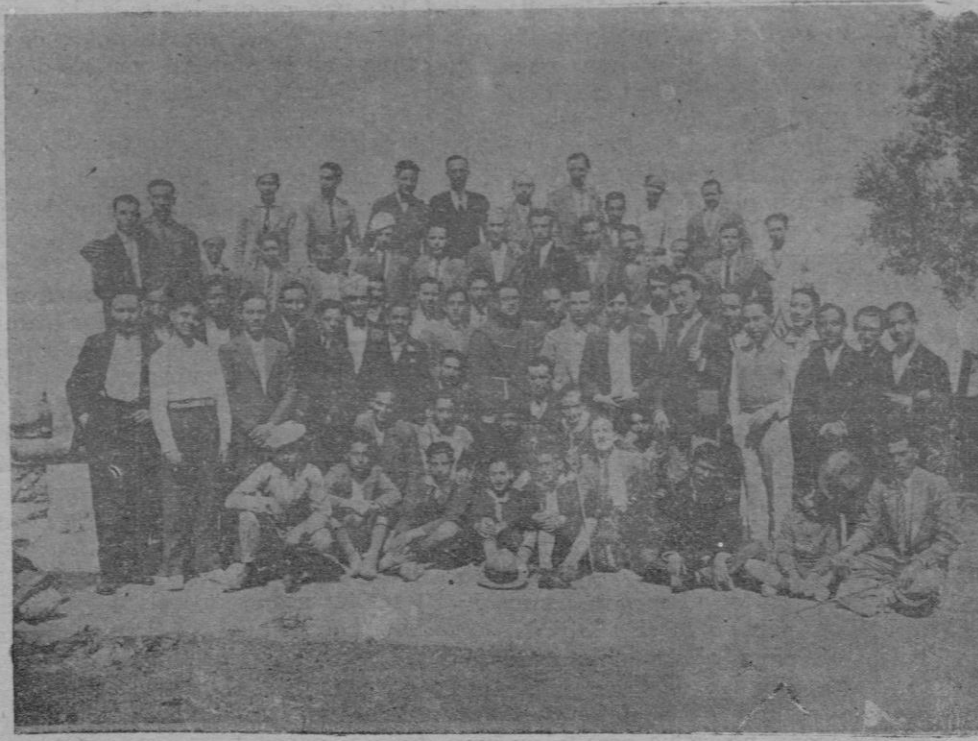
Grupo de los asistentes a la excursión realizada el domingo último a Valldemosa, Deya y Sóller