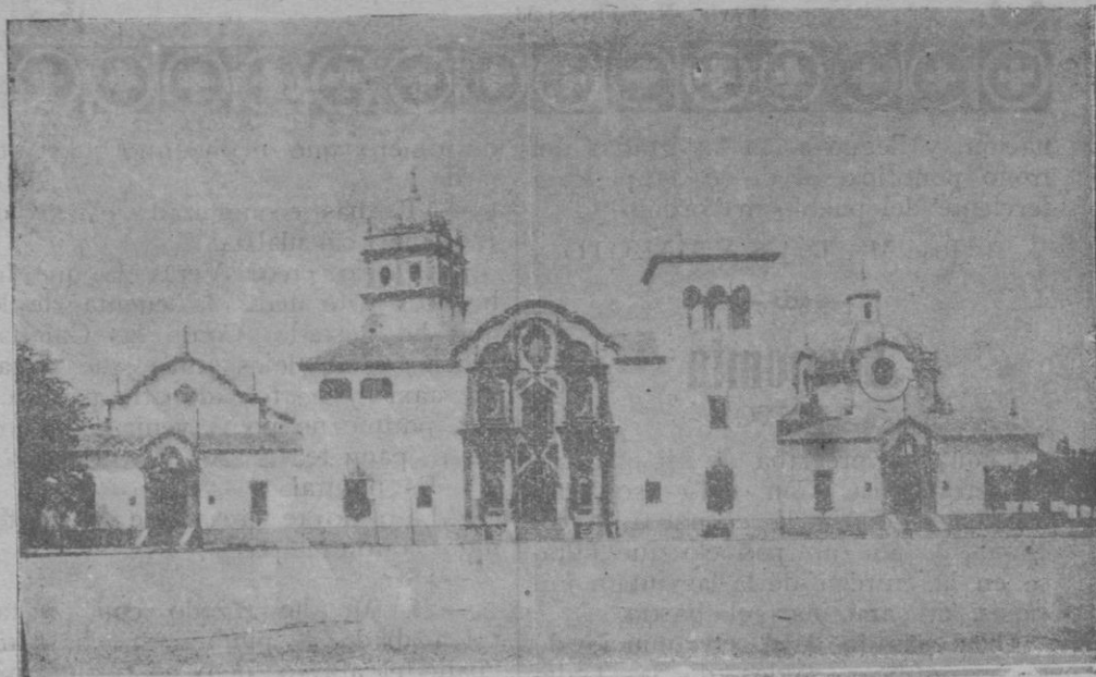
Fachada del pabellón de la Argentina