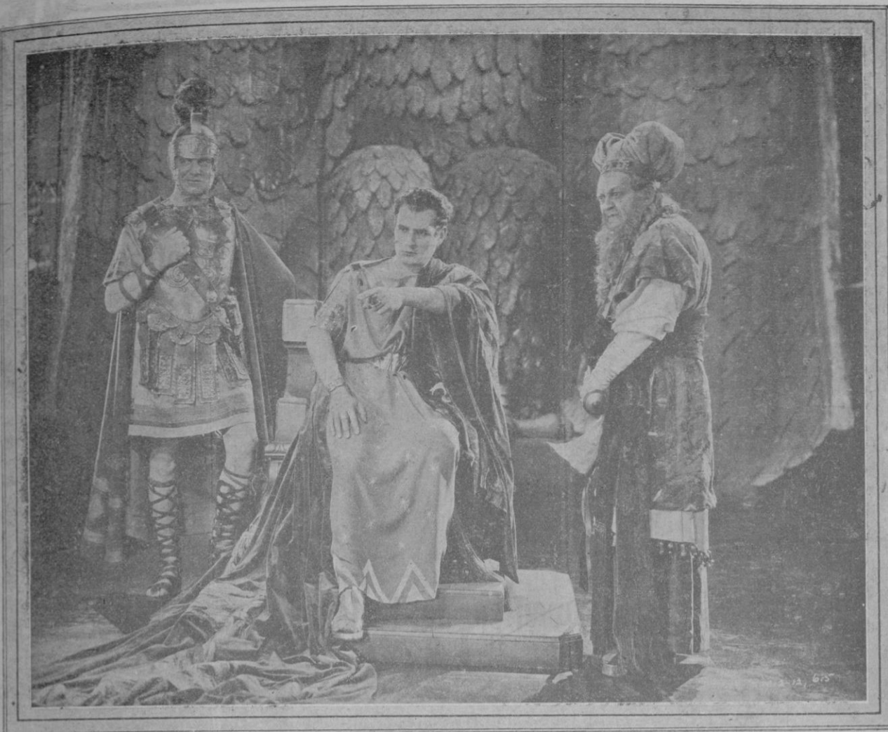
«Juicio crítico de diversas personalidades católicas»: