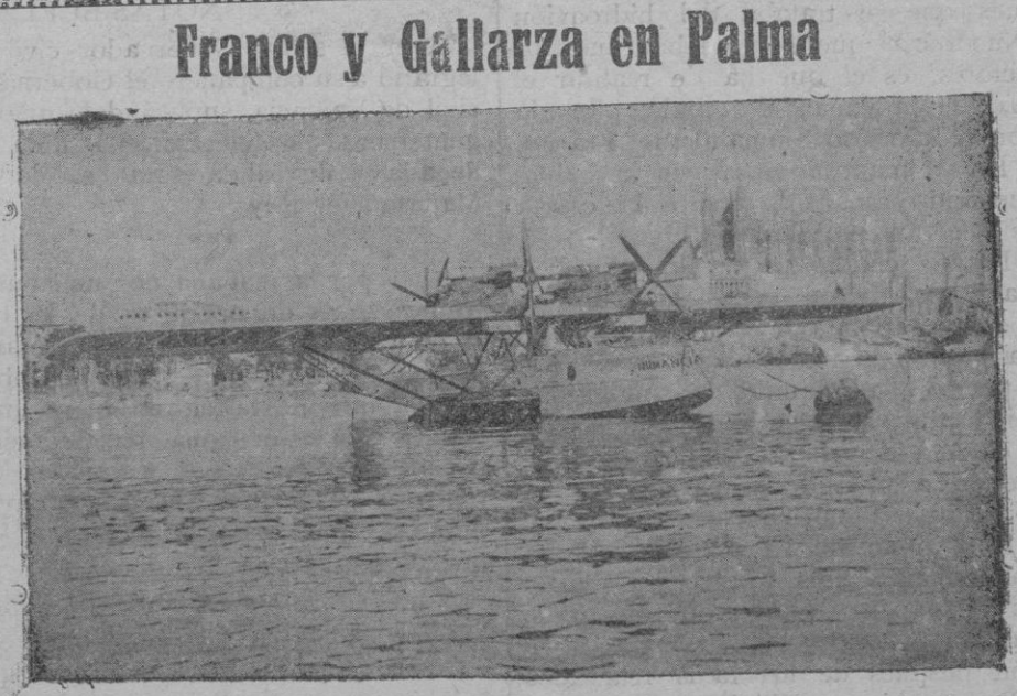
Fotografía del «Numancia» obtenida ayer tarde, poco después de su llegada a nuestro puerto

de pasar revista a la Escuadra española. No se sabe aún si S. M. se dignará desembarcar; pero seguramente por la prensa diaria podrá enterarse el vecindario de la resolución que adopte nuestro augusto Monarca sobre el particular. Para el caso probable de que honre a esta capital con su visita, esta Alcaldía espera que el pueblo de Palma sabrá rendir a S. M. merecido homenaje de entusiasta adhesión, y que cuidará de engalanar los balcones de sus viviendas, asociándose al comercio cerrando sus establecimientos. El acto que va a realizarse es importantísimo, pues significa la consagración del resurgimiento de nuestro poderío naval, y todos debemos agradecer al Monarca y a su Gobierno que nos haya dispensado el honor de que se efectúe en nuestra bahía. NOTA OFICIOSA DEL GOBIERNO CIVIL Ayer nos fué entregada la siguiente: Es gratis para el Gobernador, poder anunciar oficialmente la fausta nueva de que S. M. el Rey (q