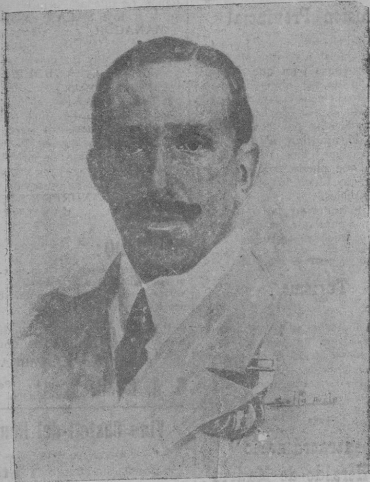
S. M. el Rey D. Alfonso XIII