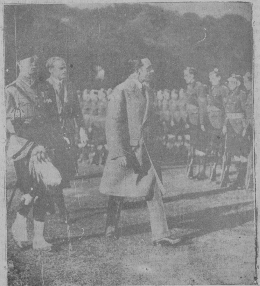
S. M. el Rey D. Alfonso al pasar revista a la guardia escocesa