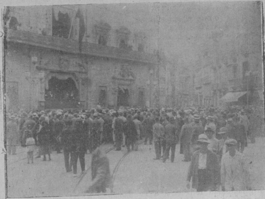
Aspecto que ofrecía la plaza de Cort en el momento que desembocaban en ella los miles de manifestantes que llegaban de la Catedral