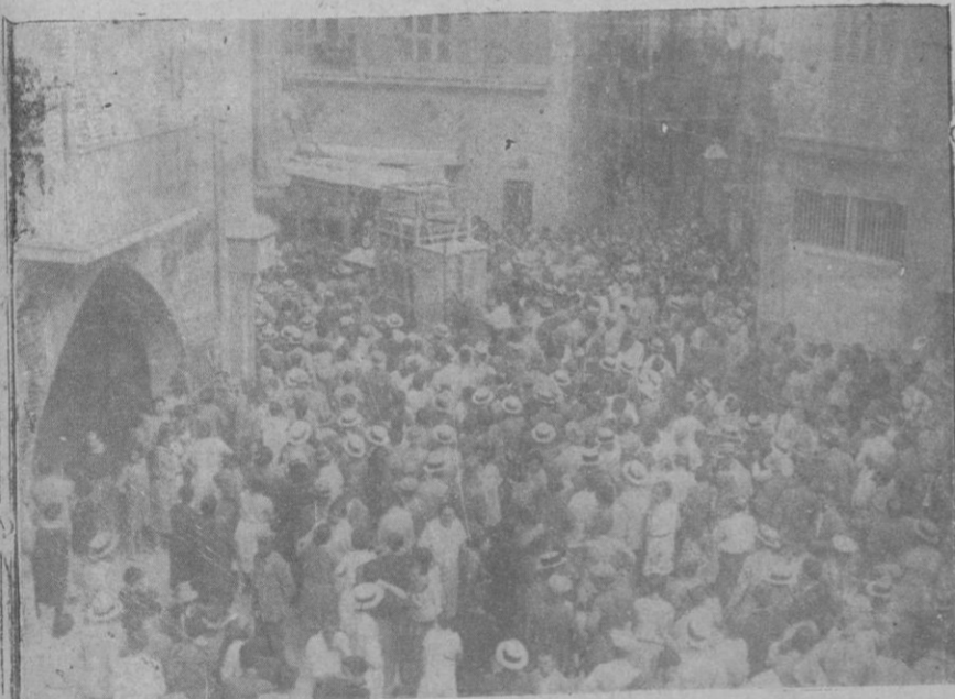
Aspecto que ofrecía la Plaza de Mercadal, al poco rato de ocurrir la desgracia. La gente aglomerándose para ver las operaciones de separar el tranvía para poder sacar el cadáver del desgraciado Antonio Roig.