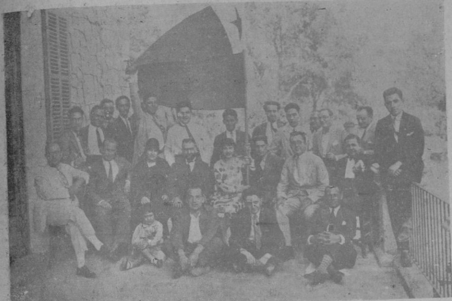
Grupo de asistentes al banquete celebrado en Ca's Catalá