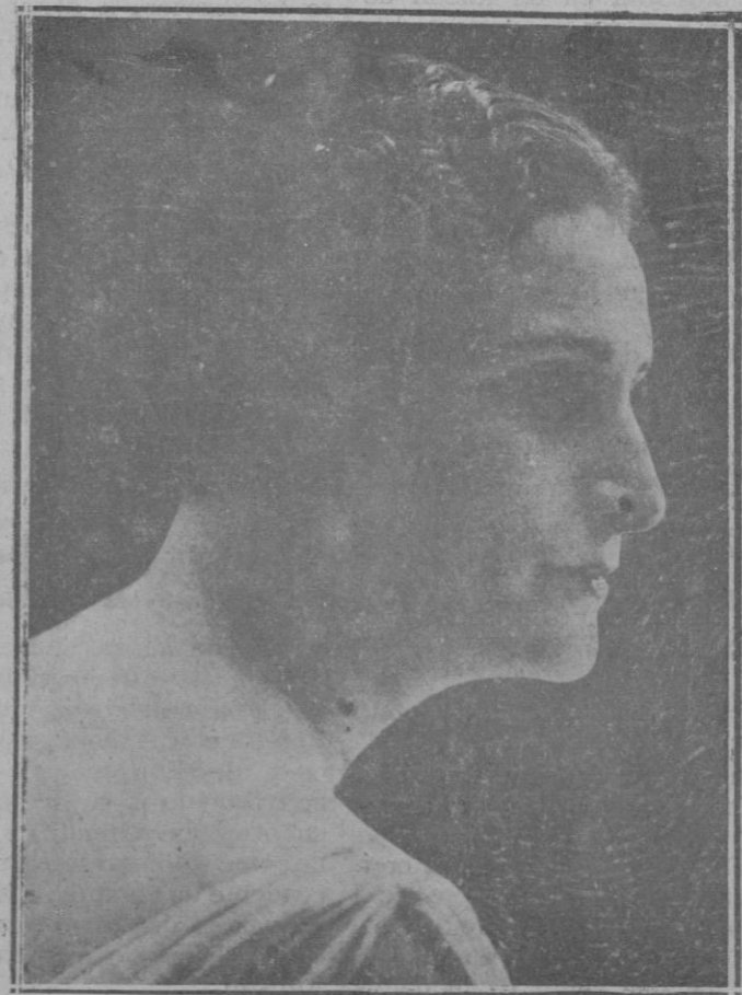
La notabilísima primera actriz Irene Lopez Heredia

trató con la debida consideración y profirió palabras verdaderamente ofensivas. El Tribunal extralimitándose, le suspendió por un mes, con la consiguiente serie de proestas del castigo, de los demás defensores y de los acusados.