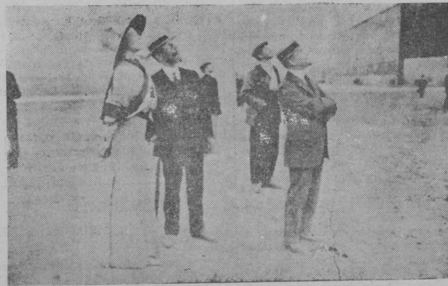
Curiosa fotografía tomada hace veinte años el día en que Farman batía el circuito de un kilómetro. Contemplan el vuelo el poeta d'Annunzio (x) y una señorita, cuyo vestido es una demostración de lo que va de ayer a hoy, respecto a modas

Claro está. Es que en el avión al mareo se añaden los porrazos para el cuerpo y el susto para el alma. Yo no estoy mareado y, sin embargo, me encuentro deshecho. Pero, en fin, ya se nos pasará todo. Con un doble descanso físico y moral.