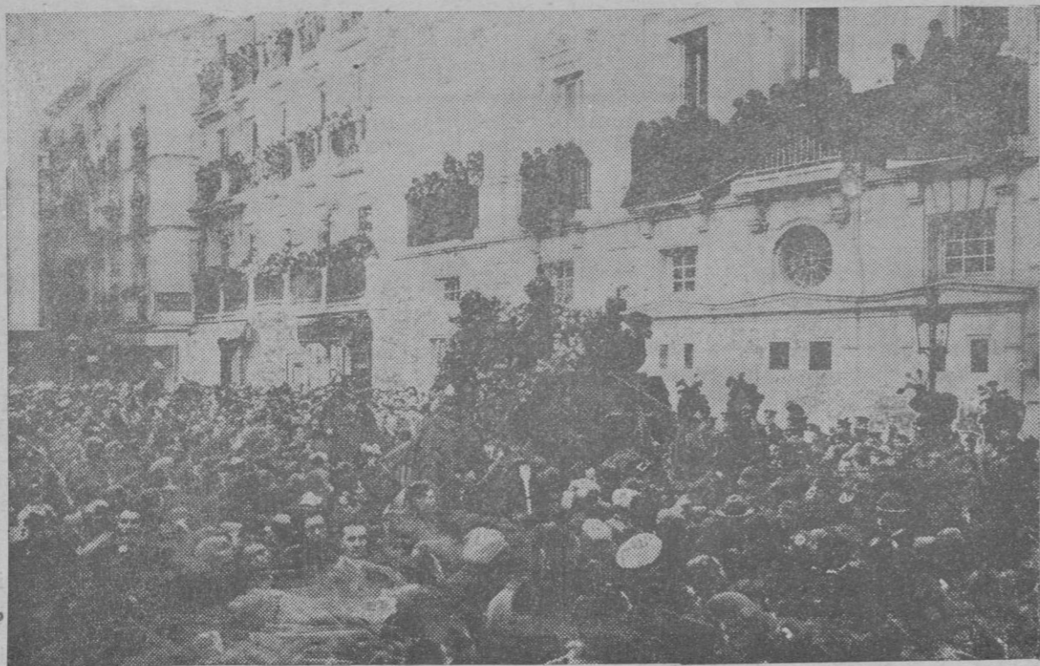
El paso de la carroza fúnebre por frente al Teatro Español