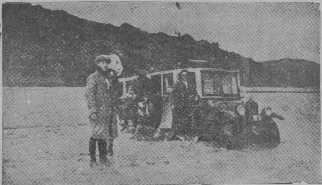
Un automóvil imposibilitado de avanzar a causa de la crecida de las aguas del río Quis