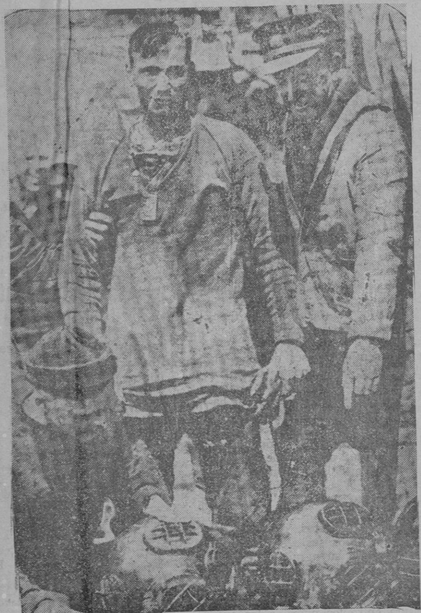
Uno de los buzos, preparándose para bajar al fondo del mar para el salvamento del submarino yanqui, hundido, cuyos trabajos resultaron estériles