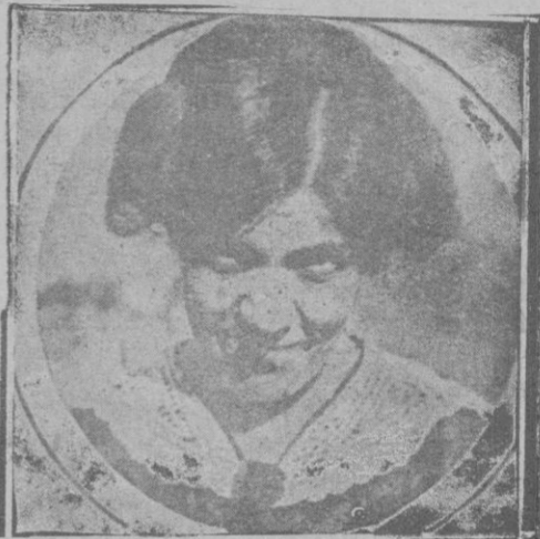
Grazia Deledda, escritora italiana que ha obtenido el Premio Nobel

de los amigos; le conté lo que me pasaba y él me prestó unos libros: unas gramáticas unos diccionarios... Con eso yo adobaba las conferencias como buenamente podía.